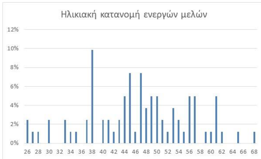
Πίνακας 3.6: Κατανομή εκτιμώμενης μελλοντικής ασφάλισης στο Ταμείο